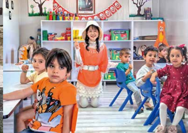
サマnderの子もたちとの出会いと交流