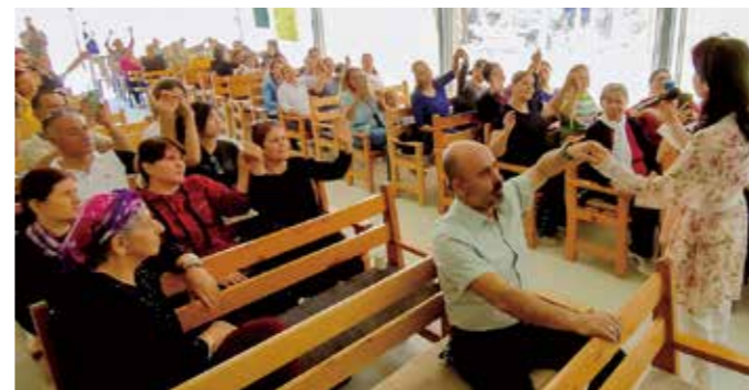
アンテオケの「メシヒチ教会」でのコンサート