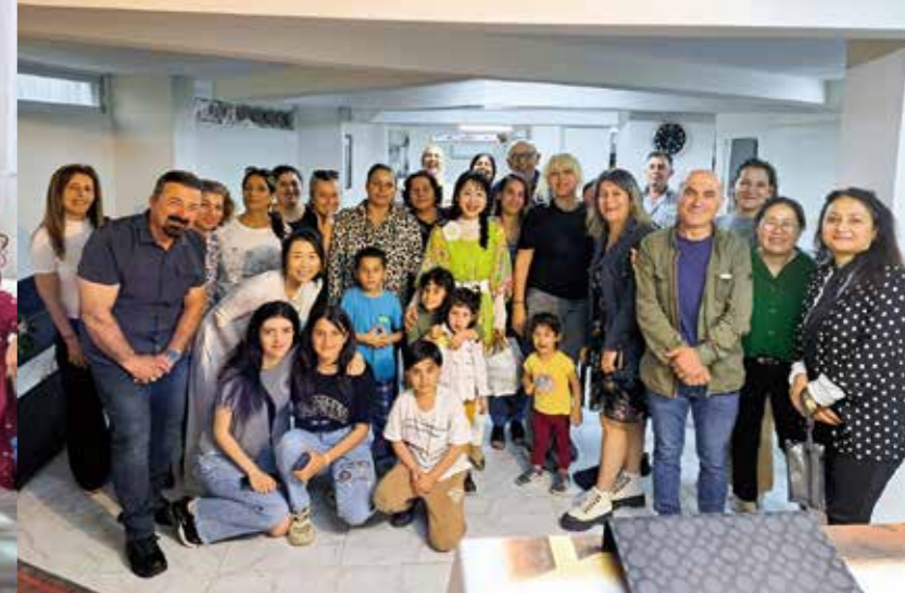
「メルスィン教会」では被災者6000人に物資を配布