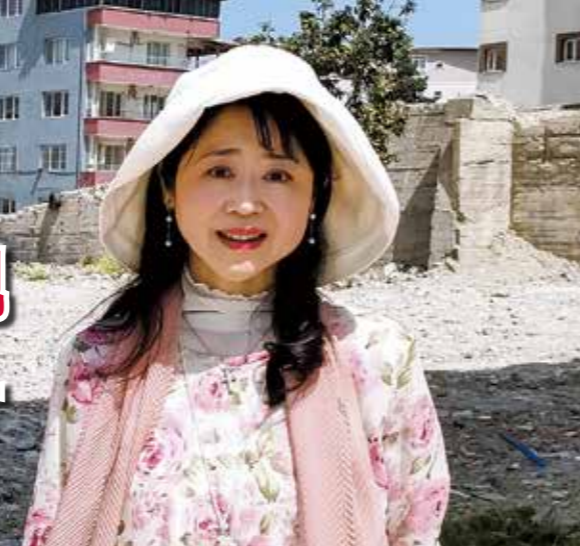
地震で街全体が壊滅状態になったアンタキアにて