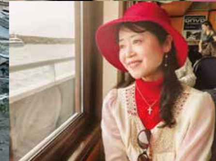
Hunger Zero News 今月号の内容