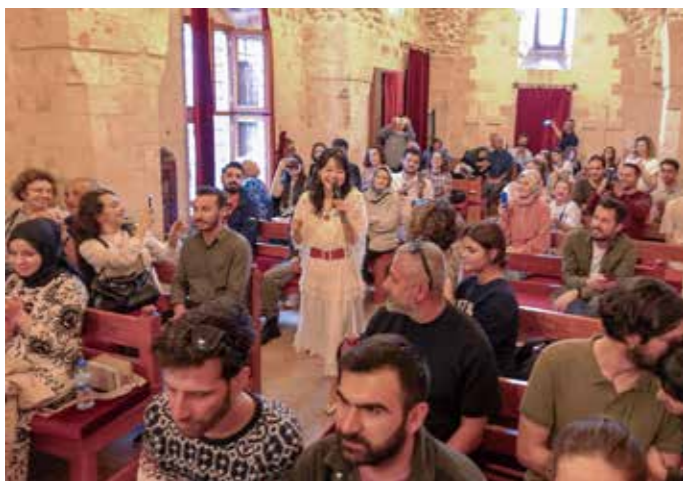
歴史的建物の「マルディン教会」でのコンサート

翌日の日曜日は、ディヤルバクル教会での礼拝です。ハンガーゼロスタッフの申牧師のお話しの前後に歌う予定でしたが、プログラムが変わり、急遽コンサートに!?大慌て