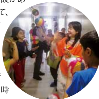
KFHI＝韓国国際飢餓対策機構